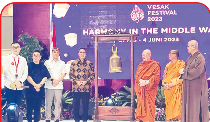
Para tamu undangan berfoto bersama.

Dia berharap, Vesak Festival 2023 yang berlangsung hingga Hari Raya Waisak, Minggu (4/6), bisa mengenalkan nilai-