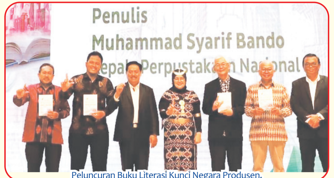
Peluncuran Buku Literasi Kunci Negara Produsen.