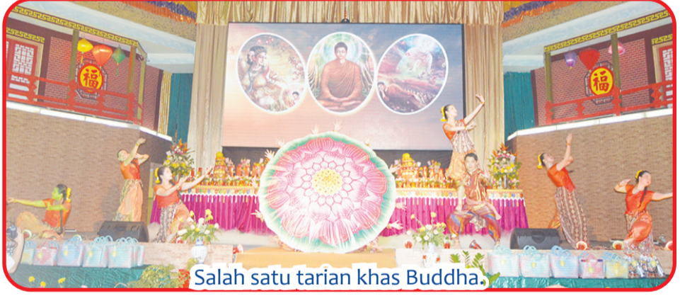
Salah satu tarian khas Buddha.