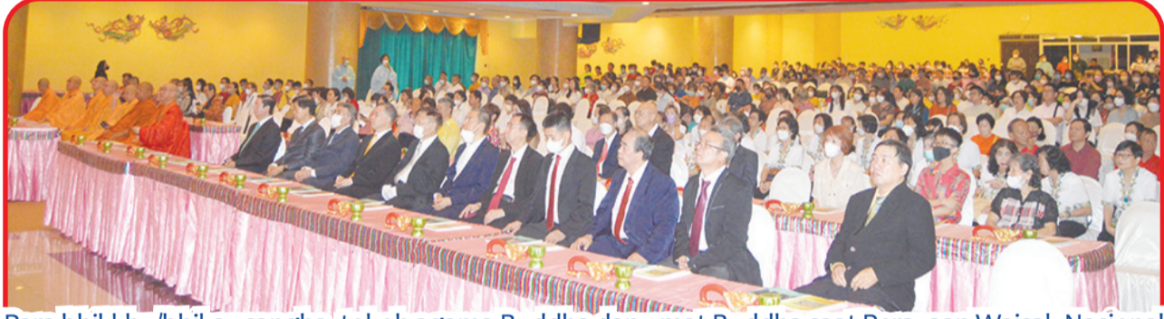
Para bhikkhu/bhiksu sangha, tokoh agama Buddha dan umat Buddha saat Perayaan Waisak Nasional 2567 BE/2023, di Auditorium Buddhist Building Vihara Mahavira Graha Pusat, Jl Lodan Raya, Ancol, Jakarta Utara, Minggu (4/6).