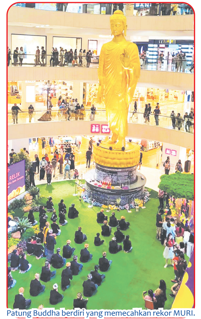
Patung Buddha berdiri yang memecahkan rekor MURI.

"Ini luar biasa, karena jika pemuda mau bergerak, dunia bisa berubah. Saya berharap pemuda Indonesia, Surabaya! khususnya, terus bergerak untuk toleransi," pungkasnya. ● Nto tze