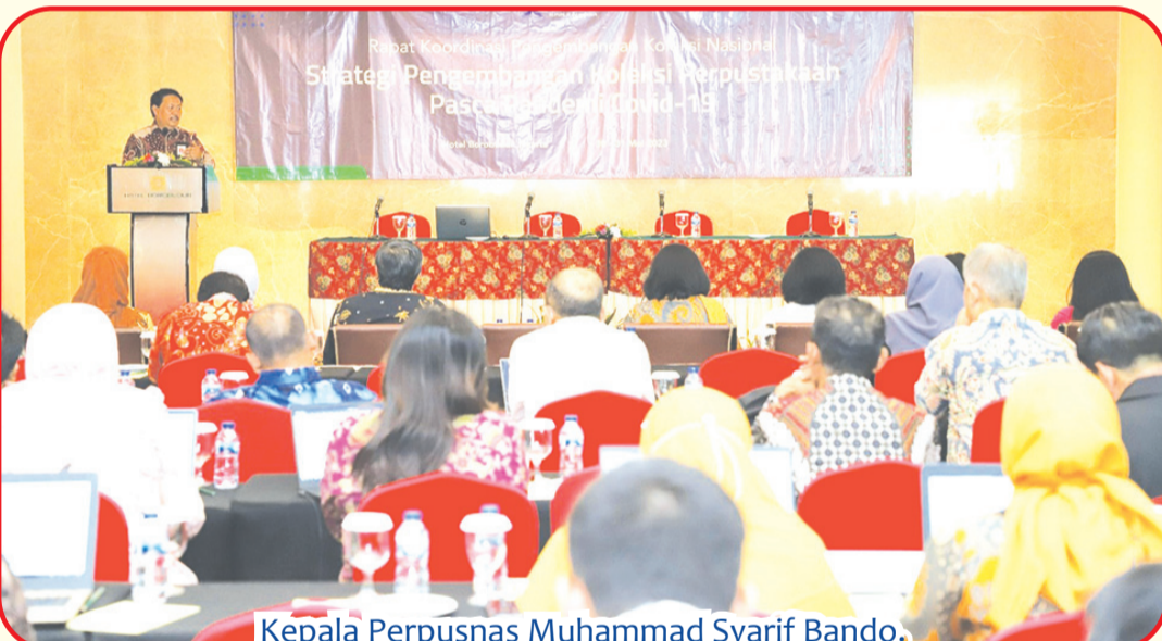
Kepala Perpusnas Muhammad Syarif Bando.

Dia menyebut jumlah koleksi Perpusnas hingga akhir tahun 2022, sebanyak 7.774.375 eksemplar. Dengan rincian, 2.890.859 eksemplar koleksi deposit dan 4.883.516 eksemplar koleksi layanan. ● bam